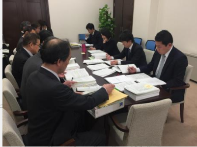
予算説明を受ける市議員